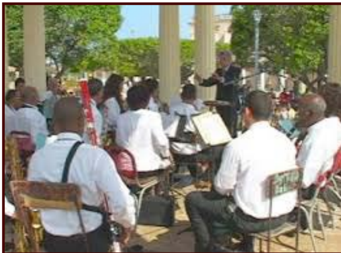
Banda municipal de conciertos de Camajuaní actuando en La Glorieta