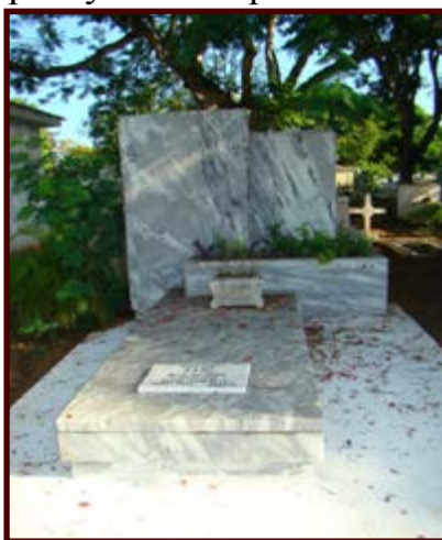
Tumba de Sindo en el Cementerio de Bayamo

Tal vez La bayamesa , cantada por su madre al acunarlo, sea una clave para conocer la respuesta. Pero pudieron ser sus visitas a esa ciudad gloriosa, donde se inició el sentir por la independencia de un país y el amor por ser cubanos, lo que atrapó su atención.