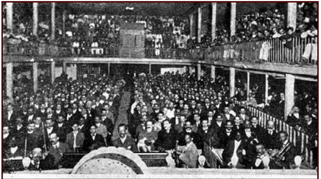
Teatro Alhambra (interior)